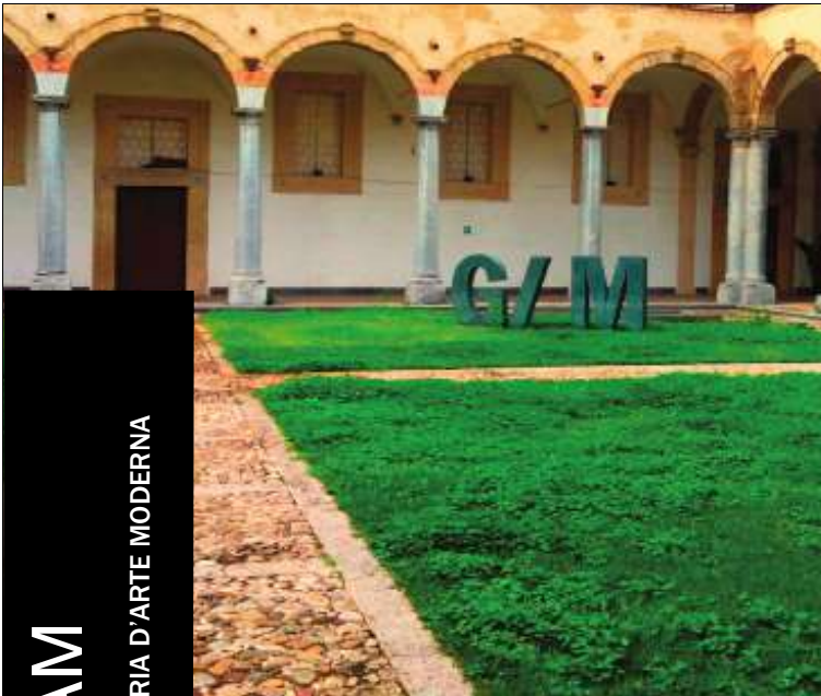
GAM GALLERIA D'ARTE MODERNA